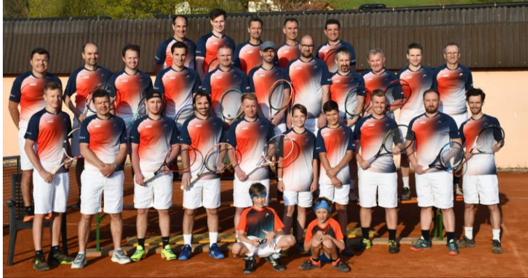
Mixed St. Stefan i. R. Future FUT C