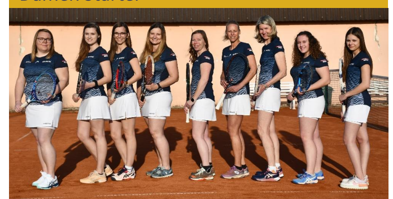
Mixed St. Stefan i. R. Starter Damen-STA D