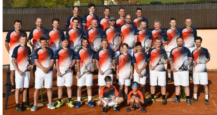
Mixed St. Stefan i. R. Starter Herren-STA C