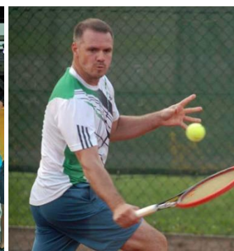
Bilder von der Matchball Steiermark Trophy und der Sommernachtsparty 2015