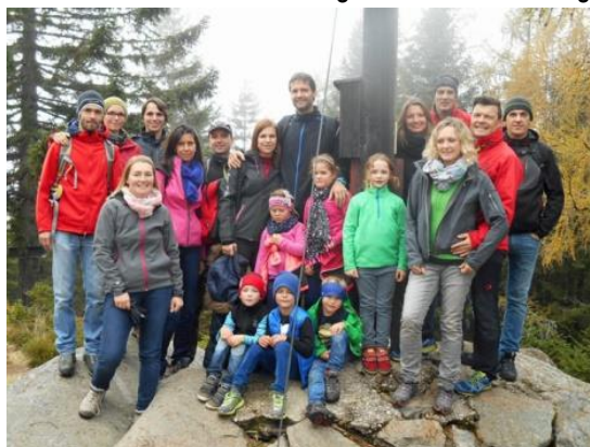
Ausflugsteilnehmer beim Gipfelkreuz am Reinischkogel

Es war wieder soweit, der alljährliche Tennisausflug stand am Programm. In diesem Jahr nahmen 20 Personen daran teil. Man fuhr mit einem Bus zum Reinischkogel von wo aus eine Wanderung unternommen wurde. Abschließend führte der Weg zum Heurigen „Landhof Steinbäck“ wo der Tag bei der wohlverdienten Jause einen gemütlichen Ausklang fand.