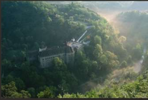
Blick Schloss Herberstein